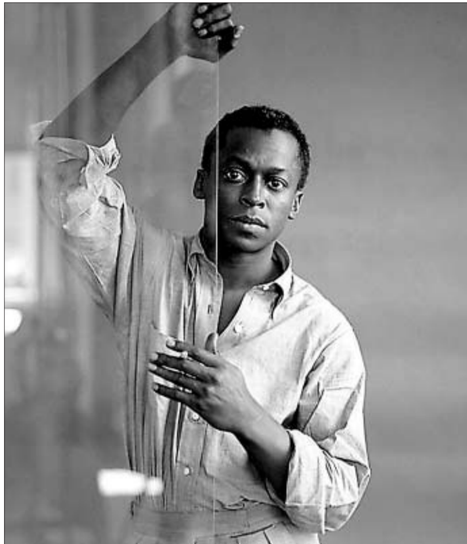
«Rebelde y negro, inconformista, frío, y con estilo», así se definía Miles Davis.

hacia la conformidad y la visión del jazz como movimiento underground se marcó toda una época peligrosa en sus excesos, pero trepidante en su inquieta búsqueda. La narración es directa, oral; Miles no tiene ni pelos en la lengua ni recelos para mostrar la zona oscura de un país que fue,