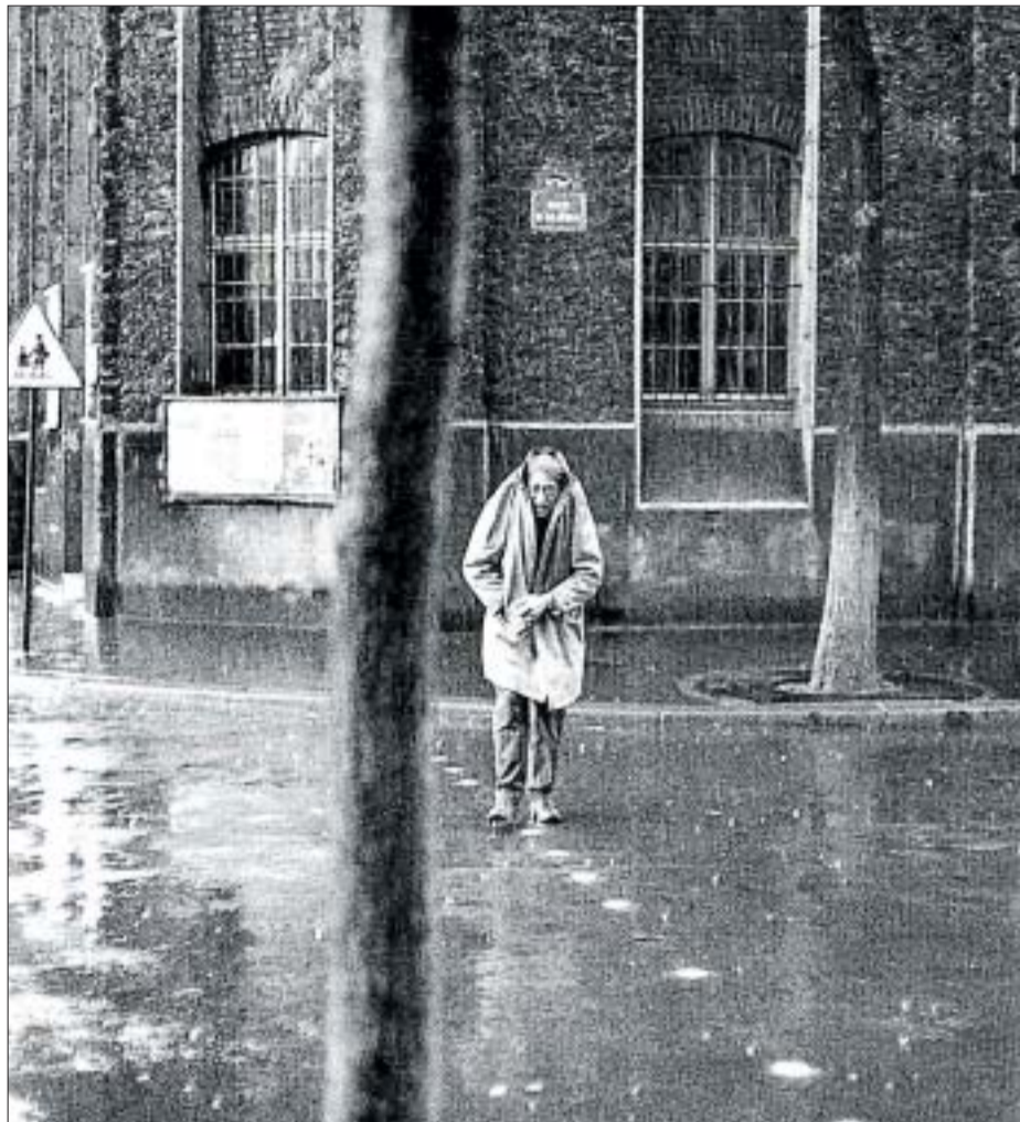
Retrato de Alberto Giacometti en la Rue d'Alésia.