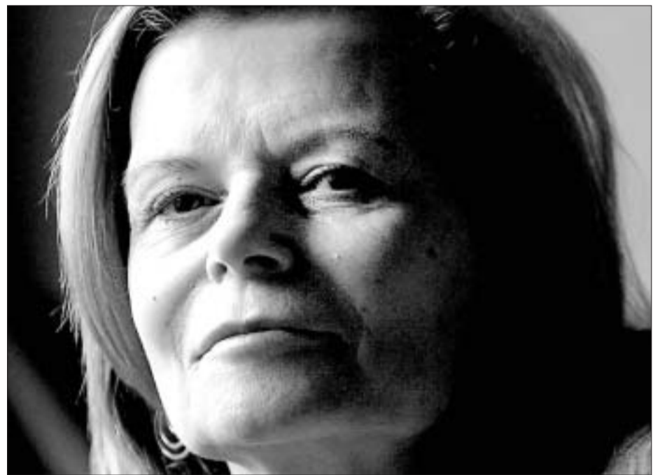
Carme Riera (Palma de Mallorca, 1948).

Justament, la recreació del tòpic de l'obsessió institucional per projectar Catalunya en el món, conjugat amb molts altres de menys lloables, permet Carme Riera –en qualitat de personatge que hauria corregit i reelaborat el suposat manuscrit trobat, signat per Mac Gregor– riure pels colzes repassant els mites locals, en clara tendència a la virilitat erèctil i fàl·lica de les muntanyes de Montserrat, la Sagrada Família o la Torre Agbar.