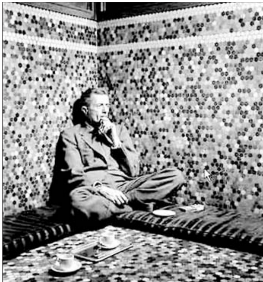
Paul Bowles, según Choukri, «el recluso de Tánger».

Acabada la II Guerra Mundial se instaló definitivamente en Tánger, también intentó vivir en los cincuenta en Trappobane (entonces Ceilán, ahora Sri Lanka). Tánger, refugio, cosmopolita, rica, agitada, ciudad internacional, entre el Protectorado Español y el Francés. Llena de encanto, contradicciones, color, o perfume intenso, lo que reflejará sin descanso en sus cuentos, de Misa de gallo , Tiempo de la amistad ,