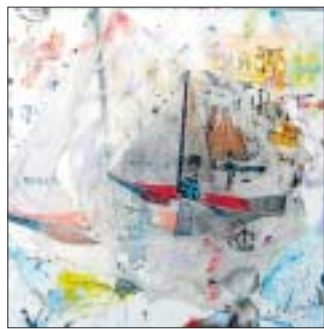
JESÚS COYTO Las dos orillas ► Galería de Arte Mayka Sánchez. C/ Grabador Esteve, 9. Valencia.

Yo que también estoy en el ajo pedí para mí al Bigotes que aunque no sea político es un prohombre al que debemos mucho. Lo estoy haciendo de metacrilato menos el bigote que va con rayos láser. Estamos todos muy ilusionados. Ya lo irán viendo.