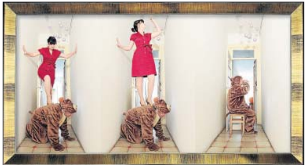
Una de las fotografías de Calderón & Paulette, titulada «El oso y la bestia» (2010).

La imagen del artista bohemio sin cargas familiares y económicas hace ya tiempo que pasó a mejor vida. La realidad es la de un colectivo de hombres y mujeres que han elegido la creación artística como su profesión y pasión, y la vez, como la mayoría de los mortales, han formado una pareja y tenido niños. Sin ser exclusivo de los artistas, los conscientes de esta elección, más evidente en el caso de las mujeres, saben que durante una larga temporada, la crianza y el cuidado de su prole les va a suponer salir de los circuitos artísticos, dejar de viajar, visitar ferias y galerías, desaparecer, en definitiva. Esta situación, con mayor o menor dramatismo, es la que interpretan magníficamente esta pareja de artistas-actores ¿O son actores-artistas? La becas, acceder a ellas o ser rechazado, cumplir años y salir del colectivo de los artistas emergentes o, por el contrario, autoincluirse en ese club, la opción misma de la maternidad son algunos temas adicionales tratados por los personajes. En un momento de-