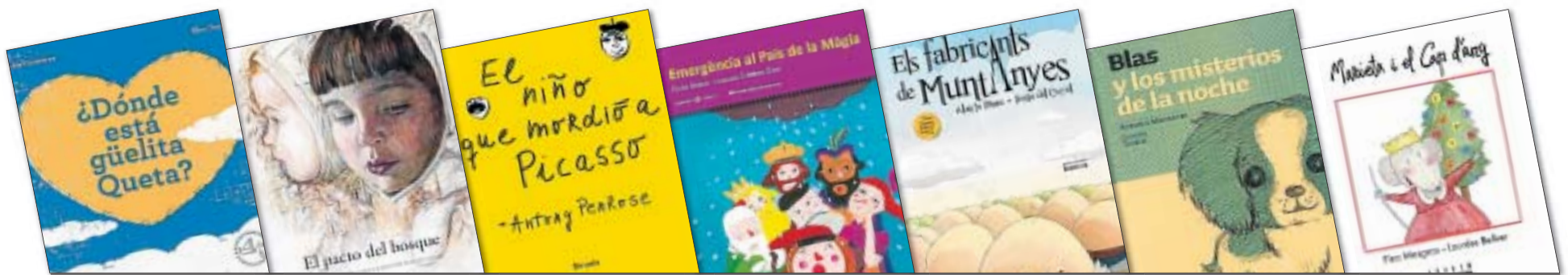
¿Dónde está güelita Queta? Nahir Gutiérrez y Álex Omist (il.). Destino, Barcelona, 2010