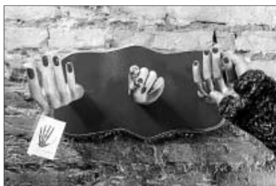
Uno de los trabajos de Xantataxan y Casanova.

Destaca la posibilidad de comprar lo que se exhibe y presumir de poseer «piezas únicas», en definitiva un «diseño» que evoca «arte». Durante el mes de diciembre talleres de reciclaje o sonoros, documentales como Consume o muere y música como la de Jazznoiza o Tranumaschine son otras propuestas de La Clínica Mundana.