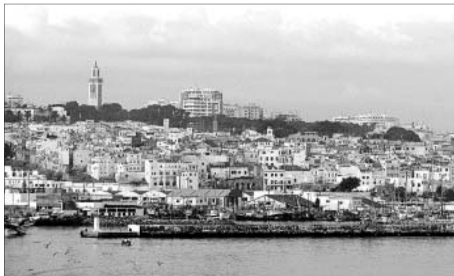
Tánger, desde el mar.

o en su novela Déjala que caiga (por cierto, Almodóvar se quedó con los derechos, y ésta es la hora).