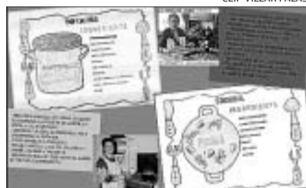
Dues fulles del receptari que ha editat l'aulari de les Barraquetes del CEIP Villar Palasí.