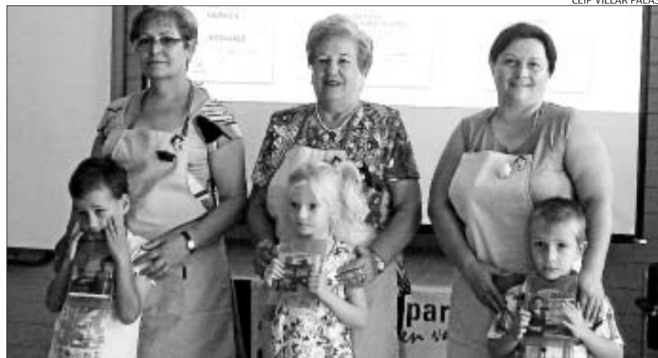
iaies i mares d'alumnes, amb els seus néts i fills i el DVD del projecte educatiu.