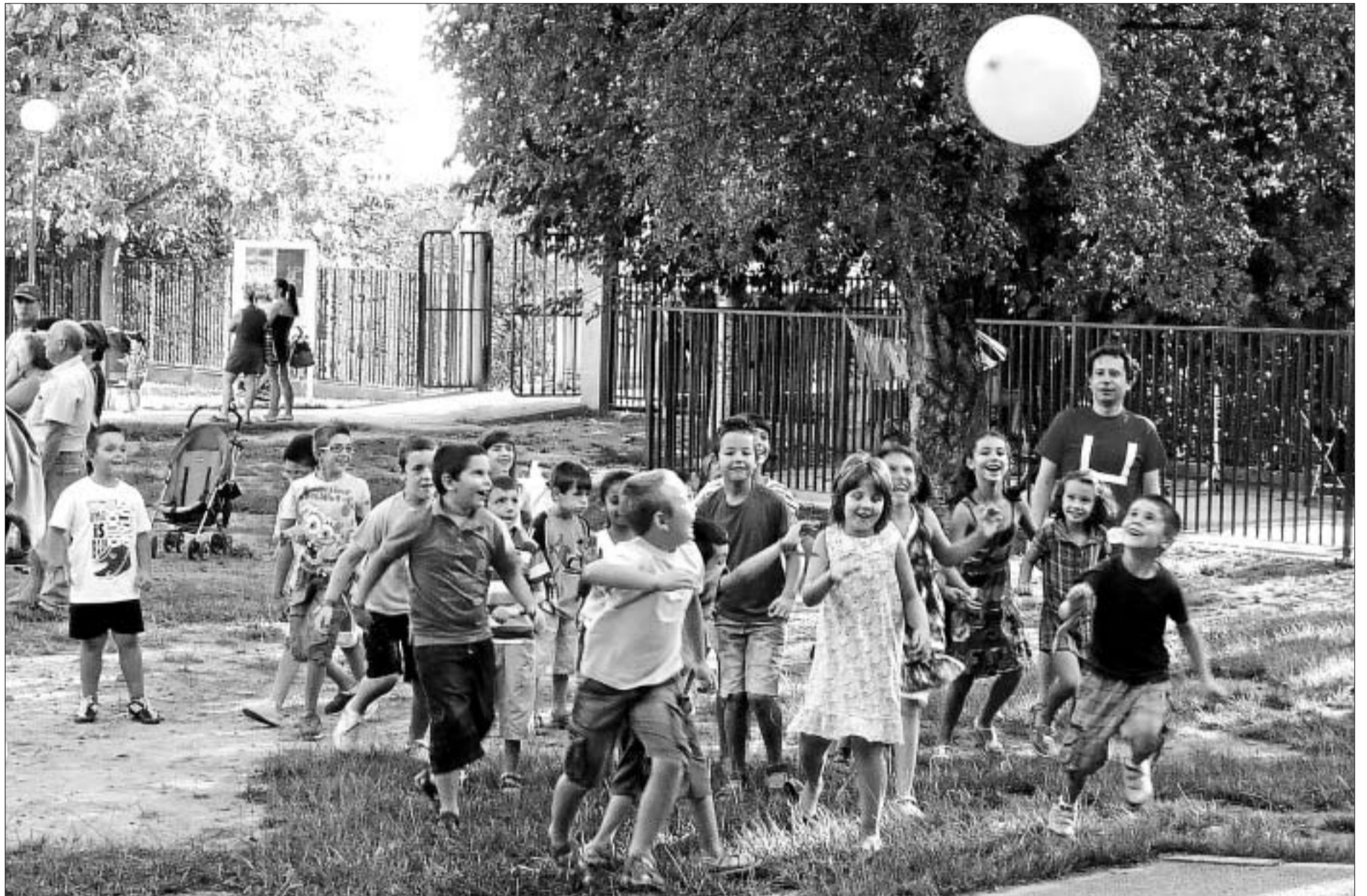
Xiquets i xiquetes del CEIP Mas d'Escoto, el passat dijous encisats amb un dels jocs de benvinguda a l'escola que els va preparar el professorat pel primer dia d'escola. CEIP MAS D'ESCOTO

► Les escoles han encetat el curs donant la benvinguda al seu alumnat. Al CEIP Mestre Caballero d'Onda els menuts de 4 i 5 anys han donat als seus nous companys de 3 anys una càlida acollida (foto), mentre que al CEIP Concepción Arenal de Vila-real , l'alcalde de la ciutat ha sigut qui ha rebut als xiquets. A més, el CEIP San Juan de Ribera de Burjassot ha preparat una festa molt olímpica.