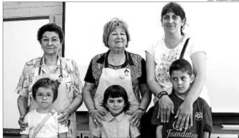
Altres mares i iaies que han participat en el projecte educatiu «Nyam, nyam, bon profit!».